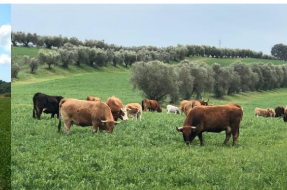
Bovine metice in pascolo olivato biodiversità genetica e agronomica