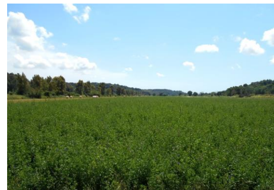
Leguminose nella rotazione agraria: la ricetta per mantenere la fertilità del suolo

De Benedictis, C. e al. Con-vivere. L'allevamento del futuro . Arianna ed., 2015